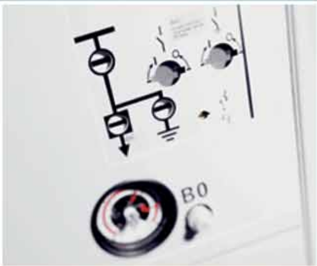
распределительное устройство 8DA10 до 40 кВ, до 40 кА, до 5000 А