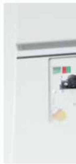
распределительное устройство типа 8DJH до 24 кВ, до 20 кА, до 630 А до 17,5 кВ, до 25 кА, до 630 А