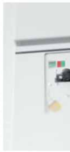
Распределительное устройство типа 8DJH до 24 кВ, до 20 кА, до 630 А до 17,5 кВ, до 25 кА, до 630 А