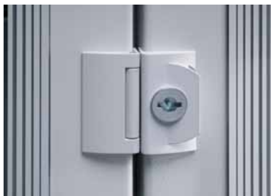
Система замков и вентиляционная система

Новые элементы дизайна повышают не только внешнюю привлекательность. Так, например, новый дизайн вентиляционной системы не только улучшает её работу, но и облегчает её обслуживание. Также, новые замки дают максимальное удобство при открывании/закрывании дверей шкафа. Применение скруглённых прозрачных дверей даёт широкие возможности для маркировки внутренних блоков и повышает информативность внешнего вида. Что, в свою очередь, обеспечивает построение более чёткой архитектуры установки в целом.