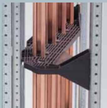
Система сборных шин