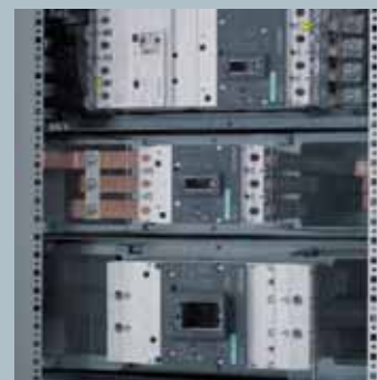
Установочные места для модулей и автоматов